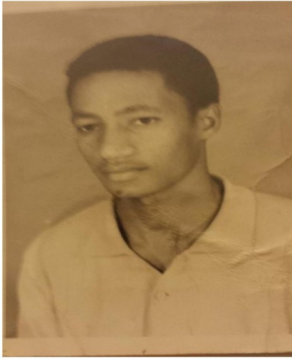
ተክሌ ፍሬሰንበት በድሬዳዋ አካባቢ በደርገ ነፈሰገዳዮች በ1970 ዎቹ ከተገደሉት የኢሕአፓ ኮዋክብት አንዱ